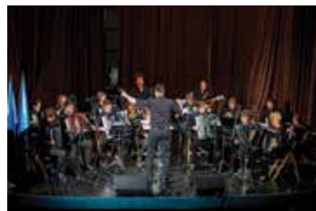
Harmonikarski orkester Glasbene šole Slovenj Gradec