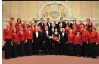
Pevski zbor Chorus Iglovia Slovaška