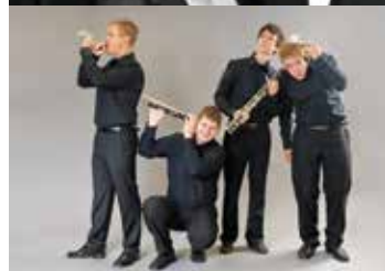
Kvartet klarinetov Claritet