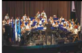
Pihalni orkester Slovenj Gradec